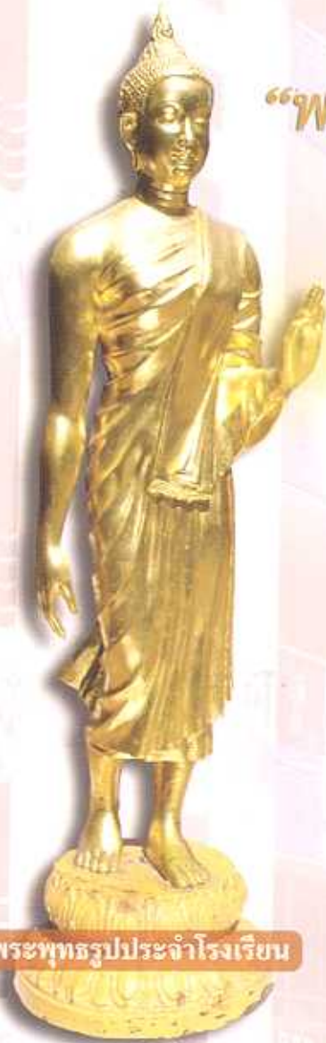
พระพุทธรูปประจำโรงเรียน

การสร้างพระพุทธรูปเพื่อเป็นรูปเคารพรำลึกถึงองค์พระสัมมาสัมพุทธเจ้า และธรรมที่พระองค์ทรงตรัสรู้ และสั่งสอนเผยแผ่ ได้เริ่มขึ้นในแคว้นคันธารราฐ ประเทศอินเดียอันเป็นแหล่งกำเนิดแห่งพระพุทธศาสนา เมื่อประมาณเกือบ ๒,๐๐๐ ปี ซึ่งเป็นกาลสมัยหลังจากที่พระพุทธองค์ทรงดับขันธุ์ปรินิพพานไปแล้วเป็นเวลายาวนานประมาณ ๖๐๐ - ๗๐๐ ปี การสร้างพระพุทธรูปเพื่อเป็นรูปเคารพในระยะเริ่มแรกก็ได้สร้างลักษณะท่าทางเพื่อเป็นที่รำลึกถึงพระพุทธรูปประวัติหรือเหตุการณ์ที่สำคัญซึ่งพุทธศาสนิกชนรำลึกถึง เช่น เดียวกับการสร้างพระศรีศากยะทศพลญาณฯเมื่อพุทธศักราช ๒๕๐๐ อันเป็นวาระพิเศษของพุทธศาสนิกชนทั่วโลกเพราะเป็นเวลาที่ยึดกันว่าเป็นถึงพุทธกาล จากความเชื่อที่ว่าพุทธศาสนาจะสืบไปได้ถึง ๕๐๐๐ ปี ในฐานะที่ประเทศไทยเป็นดินแดนแห่งพุทธศาสนา รัฐบาลในขณะนั้นจึงมีดำริให้จัดสร้างพระพุทธรูปมณฑลขึ้น และได้มีการสร้างพระพุทธรูปเพื่อเป็นองค์พระประธานของพระพุทธรูปมณฑลยี่สิบเอ็ดขึ้นออกแบบโดยศาสตราจารย์ศิลป์ พีระศรี มีพุทธลักษณะเป็นศิลปรัตนโกสินทร์ พระพุทธรูปลีลา ปางเสด็จลงจากดาวดึงส์